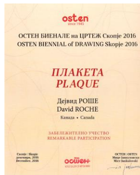
INTERNATIONAL OSTEN BIENNAL OF DRAWING