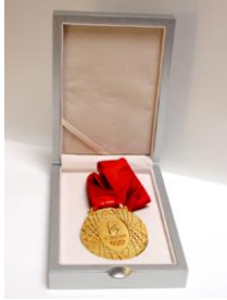
Gold medal - OLYMPIC FINE ARTS 2008

Prix Duchamp-Villon, Centre d'Exposition plein Sud, Longueuil, Québec.