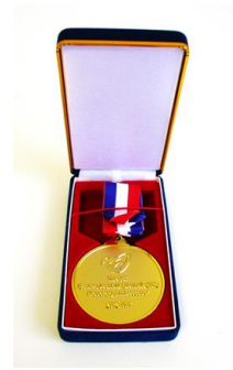
Gold medal Honorary Ambassador - E COREA INTERNATIONAL ART BIENNALE