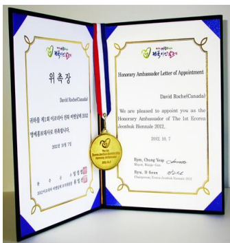
Honorary Diploma and Gold medal E COREA INTERNATIONAL ART BIENNALE