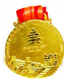
Gold medal (obverse) - OLYMPIC FINE ARTS 2008