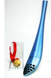
Gold medal and commemorative Olympic Torch - OLYMPIC FINE ARTS 2008