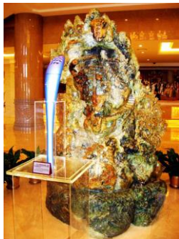
Commemorative Olympic Torch, Olympic Fine Arts 2008 commemorative Olympic Torch - OLYMPIC FINE ARTS 2008