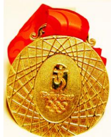
Gold medal (reverse) - OLYMPIC FINE ARTS 2008